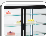
Πίσω συρόμενες πόρτες από μονωμένο γυαλί