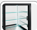
Ψυχόμενα γυάλινα ράφια