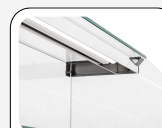
Εσωτερικός φωτισμός LED