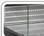
Περιοχή προβολής από ανοξείδωτο χάλυβα